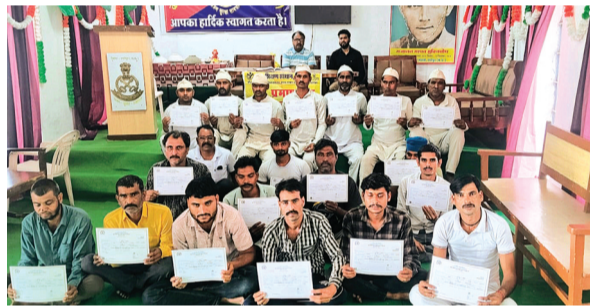
हरिभूमि न्यूज ॥ शुभपुर

कौशल विकास एवं उद्यमिता मंत्रालय नई दिल्ली द्वारा प्रायोजित जन शिक्षण संस्थान शुभपुर के माध्यम से जिला जेल श्योपुर में बंदियों के लिए आयोजित 80 दिवसीय सिलाई प्रशिक्षण के प्रशिक्षार्थियों को सफलतापूर्वक प्रशिक्षण प्राप्त करने के उपरान्त प्रमाण पत्र प्रदान किये गये। जिला जेल में आयोजित उक्त कार्यक्रम के