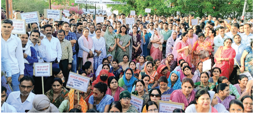
हरिभूमि न्यूज ॥ शुभपुर

शिक्षक पात्रता परीक्षा (टीईटी) की अनिवार्यता के खिलाफ देशभर के शिक्षकों की तर्ज पर बुधवार को जिले के शिक्षकों ने लामबंद होकर प्रदर्शन करते हुए राष्ट्रपति के नाम ज्ञापन जिला प्रशासन को सौंपा। इससे पहले शिक्षकों ने शहर में बाइक रैली और बाद में पैदल मार्च भी निकाला। शहर के श्री हजारेश्वर पार्क में एकत्रित हुए शिक्षकों ने टीईटी को एकाग्र करने को शिक्षकीय पेशे को बदनाम करने वाला बताकर इसे